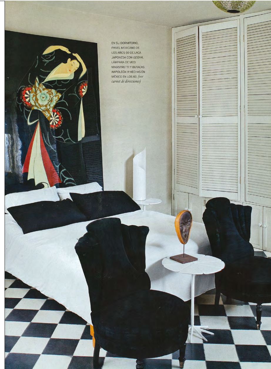
EN SU DORMITORIO, PANEL MEXICANO DE LOS AÑOS 60 DE LACA JAPONESA CON GEISHA, LÁMPARA DE VICO MAGISTRETTI Y BUTACAS NAPOLEÓN III HECHAS EN MÉXICO EN LOS 60. (ver carnet de direcciones)

Chic by Accident . Alvaro Obregón, 49. Colonia Roma Norte, México D.F. Tel.: +52 55 5511 1312. www.chicbyaccident.com